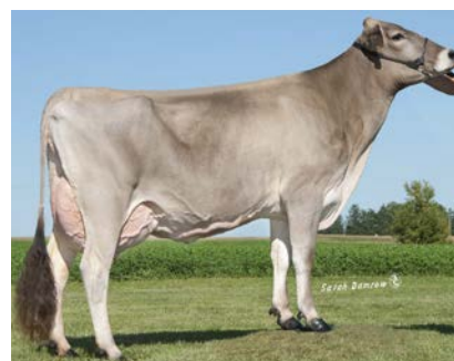
Harts Lady Lust